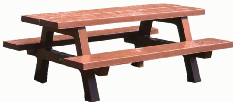
Version béton «teinté finition veinée bois ocre », longueur 2000 mm